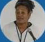
Yipsi Moreno González