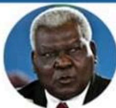
Esteban Lazo Hernández Presidente de la ANPP