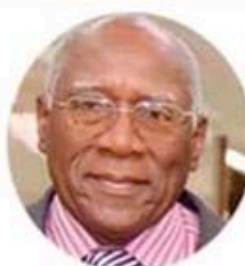
Salvador Valdés Mesa Vicepresidente de la República de Cuba